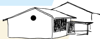
3-6 Tagesschule Alle 3.-6. Klassen